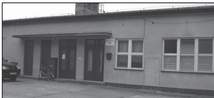
Současná MŠ před rekonstrukcí