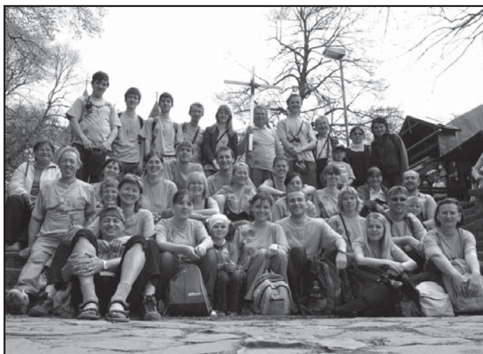
Příští rok zde můžeš být i ty!