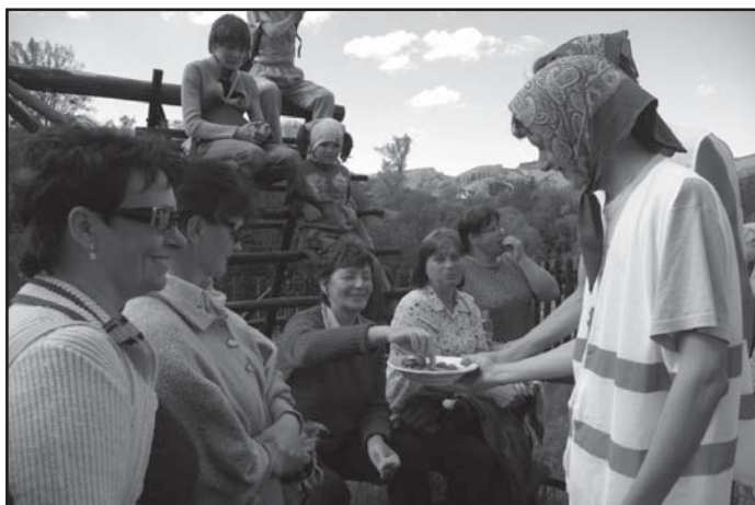
Sobotní vítání posledních poutníků