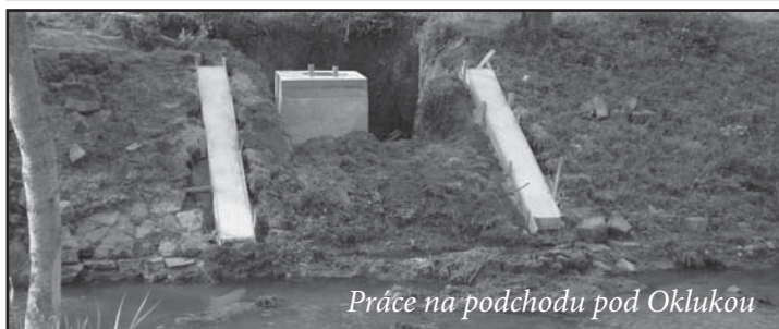
Práce na podchodu pod Oklukou