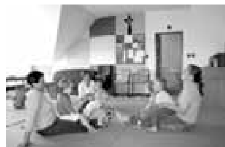
A tady jsme v našem domečku, v Pastoračním centru P. Antonína Šuránka.