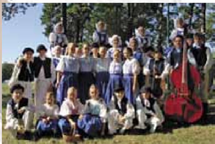
Hosté ze slovenské Myjavy, soubor Kopaničárik.