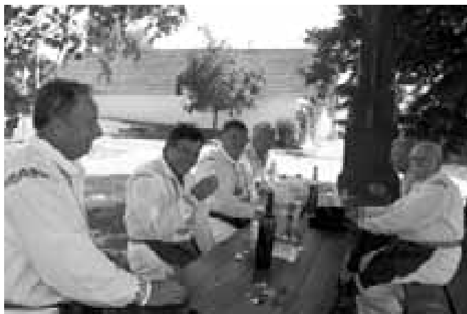
Někteří chlapi z místního mužského sboru.