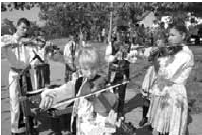
Místní dětská cimbállovka.