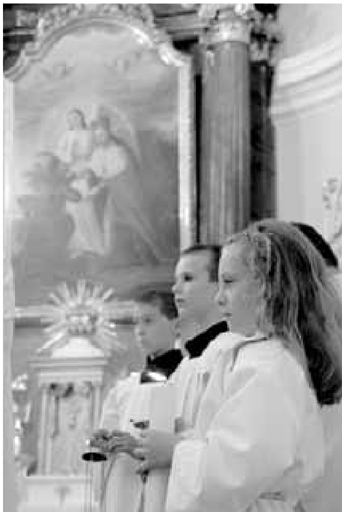
V novoveském kostele bylo vidět hodně mladých lidí.

Velkou tradici tady mají hasiči, nechybí spolky myslivců, včelařů nebo vinařů, velké úspěchy sklízí divadelní skupina BLIC, hodně lidí se věnuje sportu, proslulý je zdejší kanoistický oddíl. A nesmím zapomenout na mnoho zajímavých výstav. K péči o tradice samozřejmě patří, kromě