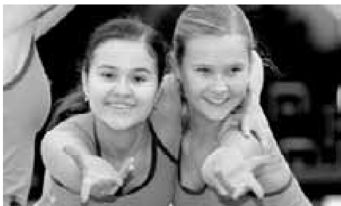
K Ostrožské Nové Vsi patří také Aerobik klub Stonožka. Při oslavách se divákům představilo kolem dvaceti dívek, tady na snímku jsou v detailu dvě z nich.