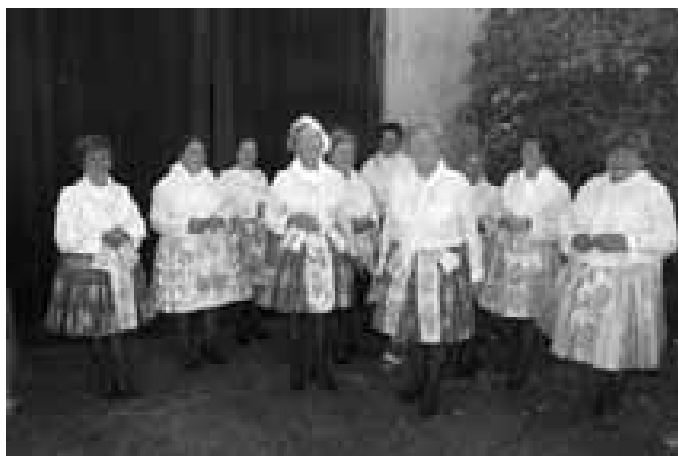
A nakonec členky blatnického ženského sboru.