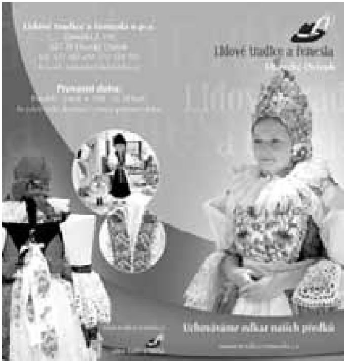
Aktuální propagační materiál ostrožské krojové dílny. Ten dokazuje, že dílna půjde vlastní cestou s novou značkou a názvem

Jakékoliv informace k zakázkám získáte na tel.: 732 558 971