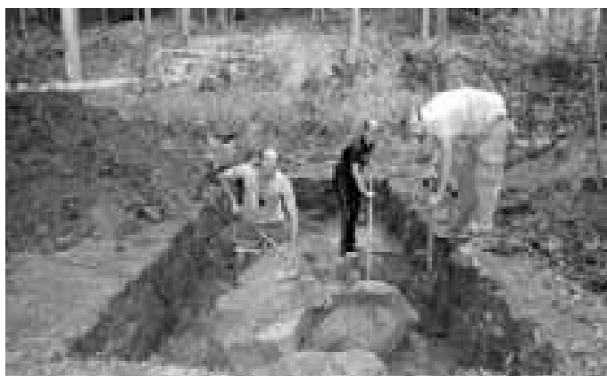
Při „hledání“ historie pomáhají také studenti, kteří tak tráví mimo civilizaci i několik týdnů.

výkon srovnatelný se stavbou pyramid. Museli to stavět tisíce lidí, museli mít výbornou organizaci práce, kterou museli řídit tehdejší