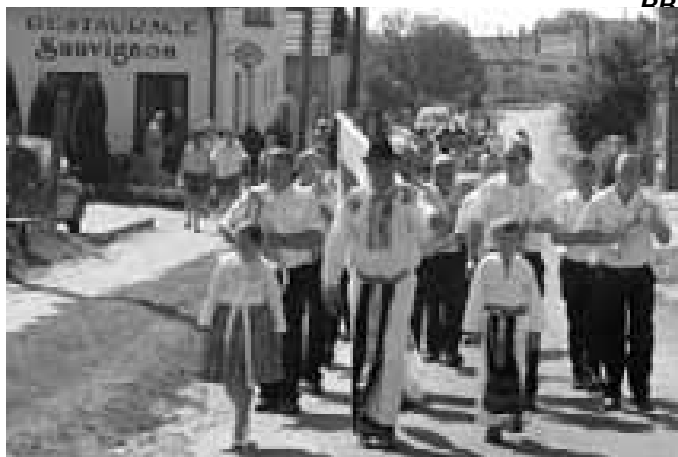
Průvod od radnice ke sklepům.