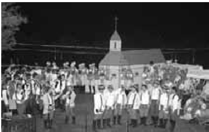
A TY SVATÝ ANTONÍNKA ANEB HORŇÁCI NA PÚTI. Pořad s tímto názvem vyvolal u diváků na letošních Horňáckých slavnostech nadšení.