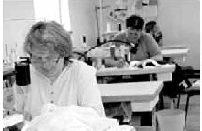
Zaměstnankyně krojované dílny v Uherském Ostrohu. Také na jejich zručnosti záleží, jak se bude dílně v nové situaci dařit.

Dílny v Uherském Ostrohu přitom „pádlí“ do nového období s pořádnou silou. Už vznikají zcela nové internetové stránky a také se vyrábí úplně nové propagační materiály. Samozřejmě s novým názvem i novým