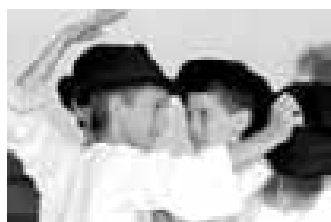
Kluci z folklorního kroužku Pomněnka, v němž se se snaží vést děti k tančení i ke zpěvu.