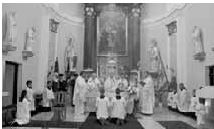
Kostel byl při nedělní slavnostní mši zcela plný - prý tomu je ale tomu tak i v jiné neděle. Přítomno bylo několik kněží - rodáků, další důkaz toho, že víra má tady ještě silné místo.