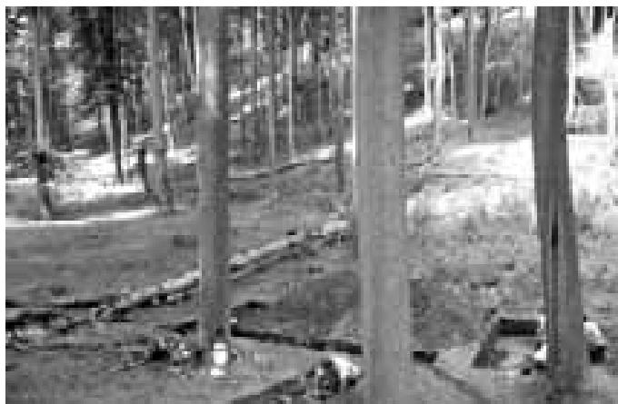
A tady už jsou přímo místa vykopávek. Nedaleko Buchlova měli naši předci úkryt i útočiště.