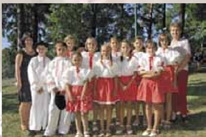
Pomněnka z Ostrožské Nové Vsi.