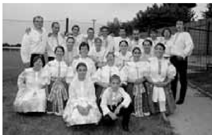
Novoveská chasa. „Stálý“ soubor, který by se věnoval lidové hudbě, obec nemá. Právě v chase je ale skupinka lidí, kteří mají o tuto hudbu zájem, brzy také pořádají hody. Prý jich spíše v souboru přibývá než ubývá.