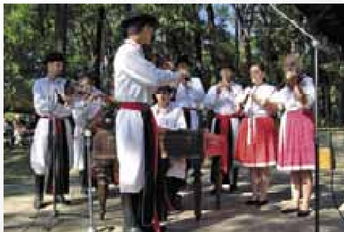
CM Višňa z Ostrožské Lhoty.