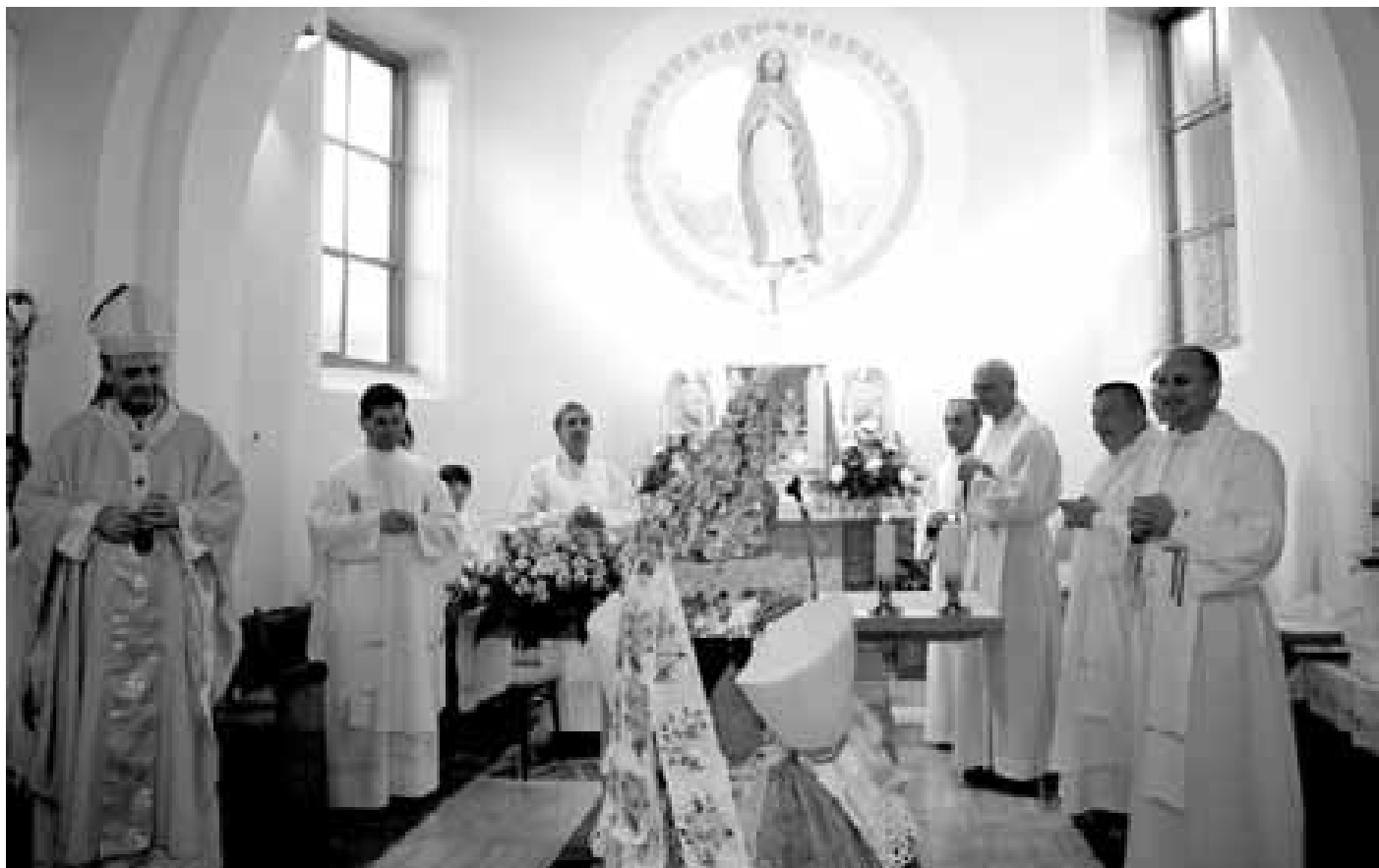
Slavnostní mše svatá, připomínající sedmdesát let kostela v Blatničce. Místní lidé kostel „vyšňořili“ do posledního detailu, po mnoha letech proběhla také náročná oprava varhan.