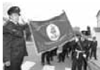
Novoveští hasiči se zcela novým – a také vůbec prvním – praporem. Historie hasičů je dlouhá, nedávno slavili 120 let existence.