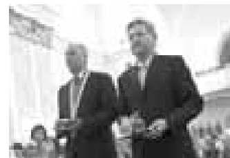
Starosta (vlevo) a místostarosta obce, tady jsou v kostele při slavnostní mši, k oltáři právě nesou obětní dary.