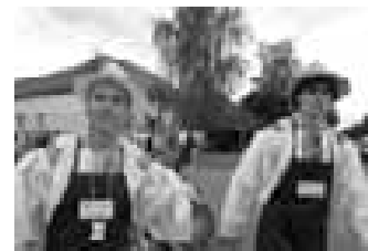
Spolků je v obci několik. Například vinaři, ale také myslivci nebo včelaři. A samozřejmě i Orli. Tady jdou vinaři, kteří ovšem byli v průvodu jen dva.