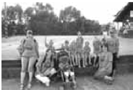
Jedeme na výlet do Ostravy!