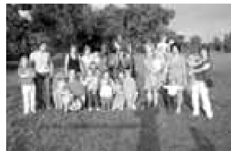
Na hřišti s panem starostou Jelénkem, na jehož koni jsme se děti vozily.