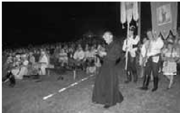
Pořad o sv. Antonínku právě začíná. Procesí míří kolem diváků na jeviště.