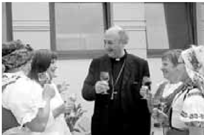
Olomoucký arcibiskup Jan Graubner při jednom ze setkání na zahradě bývalé školy.

Po mši se vydal krojovaný průvod na velmi pěknou zahradu bývalé