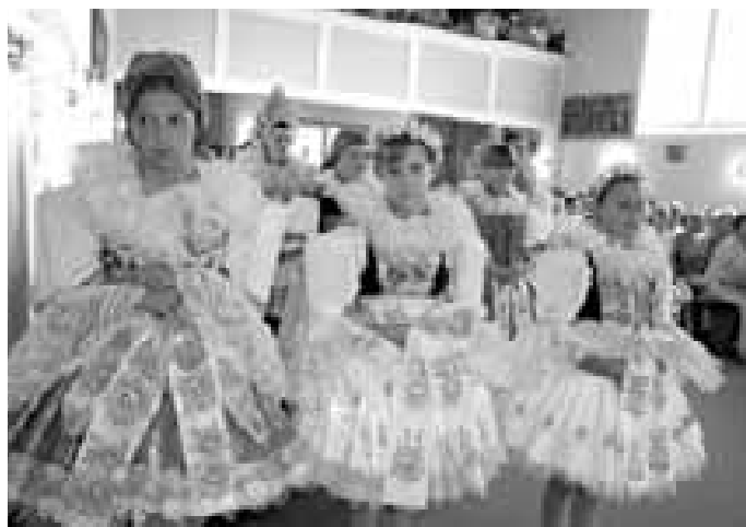
Atmosféra v kostele byla hodně slavnostní. Několik dívek oblékly maminky a babičky do místních krojů.