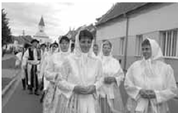
Ženský sbor neexistuje v Ostrožské Nové Vsi dlouho. O to více ale vystupuje a také se pravidelně schází na zkouškách. Další důkaz toho, že lidé v obci mají o kulturní dění zájem.