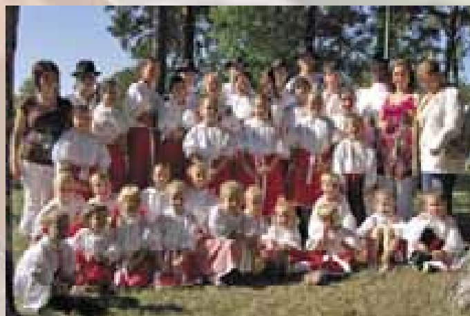
Kameňáček z Ostrožské Lhoty.