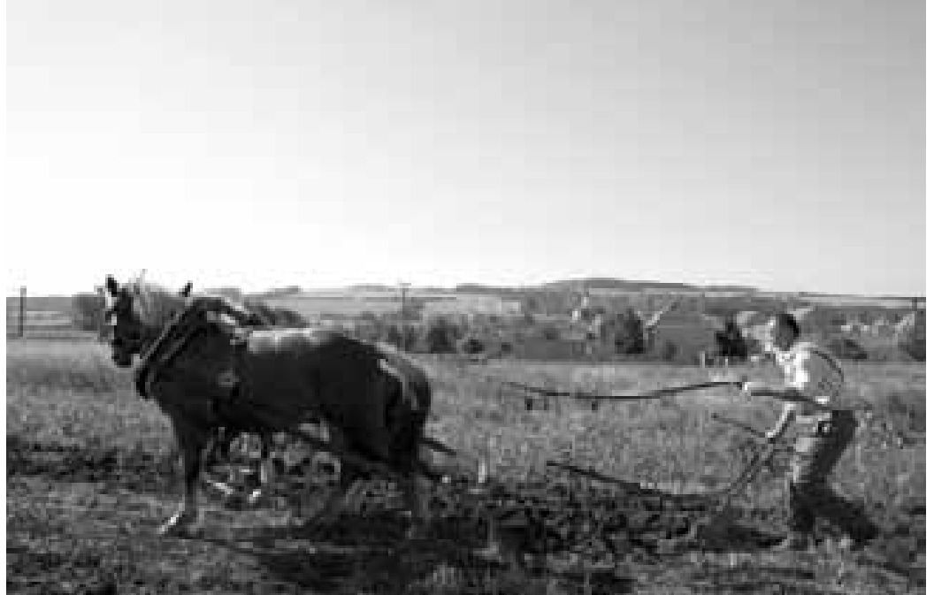
Léto odchází, přichází podzim. Polní práce na Slovácku, vidět takto koně jde už výjimečně.