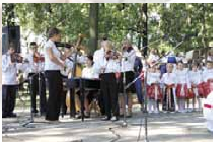
Blatnická cimbalová muzika.