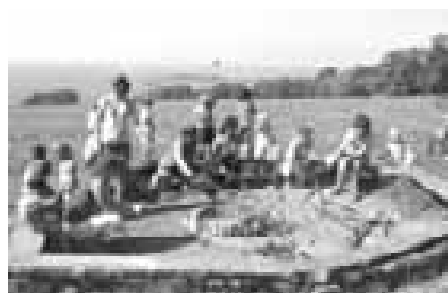
Výlet na Antoníněk - opékali jsme špekáčky a hledali poklad obra Bohumila.