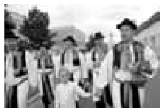
A samozřejmě nechybí ani mužský sbor, který si dal poněkud nezvyklý název – Krasavci.