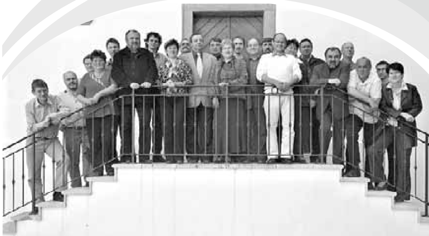
Členové Místní akční skupiny Horňácko a Ostrožsko.