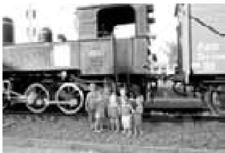
A tady už jsme v Ostravě!

i na dalších žádostech o granty, ale neuspěly. Pořádná „injekce“ nakonec přišla z Regionálního operačního programu, pět a půl milionu korun, za které bude ve Lhotě vybudováno dětské hřiště i s celou odpočinkovou zónou. Právě nyní se dokončuje ve spolupráci s maminkami projekt a probíhají debaty, jak by mělo celé hřiště vypadat. „Navíc se nám už podařilo dostat na hřiště první herní soupravu se skluzavkou,“ podotýká Jitka.