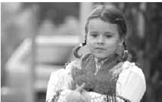
Holčička z Boršic u Blatnice. Přijela se svými rodiči, otec vystoupil v kulturním programu v boršickém mužském sboru.