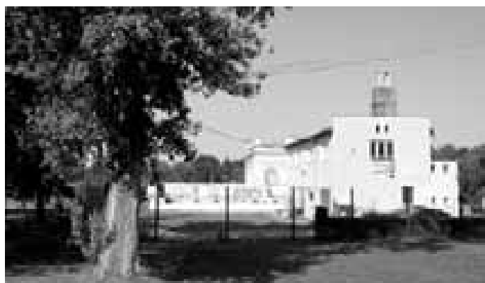
Zámecké zahradnictví patřilo v době svého vzniku k unikátním místům. Byla by velká škoda, kdyby zaniklo. Veseláné by měli pozorně sledovat, co se bude dít se zámek a jeho okolím.