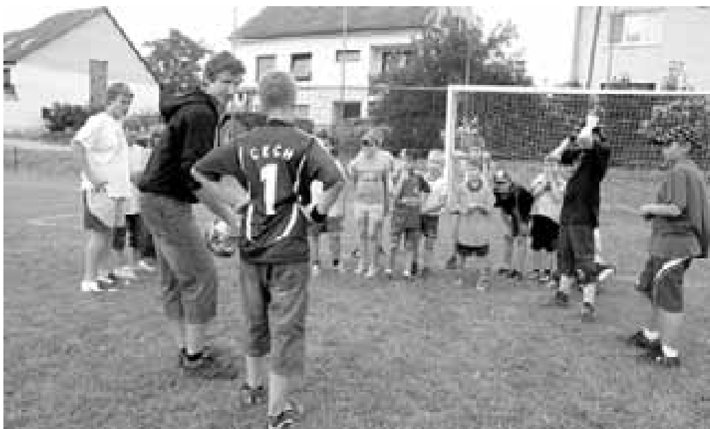
Zájemců o fotbal je na vesnici pořád dost. Přesto ale děcek, ochotných pravidelně a naplno sportovat, rapidně ubývá. To se projevuje i v menším počtu mladých fotbalistů v našem regionu.

Ženské obvykle nadávají, ale většina chlapů míří každou druhou neděli na fotbalové hřiště, kde právě ten jejich mančaft hraje nejdůležitější zápas v republice. Je to stejné všude, i na Slovácku a Horňácku. Výsledky a postavení v tabulce jsou tak trochu vizitkou každé vesnice. Někde se daří víc, o pár kilometrů dál mají funkcionáři z výsledků hlavu ve smutku. Někdy se zdá, že fotbal na dědině dělá fotbalový výbor, ale většinou je to o nedocenené práci dvou nebo tří jedinců, kteří táhnou celý klub. Bez těchto obětavých a zapálených lidí by vesnický fotbal už dávno umřel. Někde za pár korun, jinde úplně zadarmo věnují tomuto sportu nespočet hodin a energie. Podívejme se, v jakém stavu je fotbal v některých místech našeho regionu.