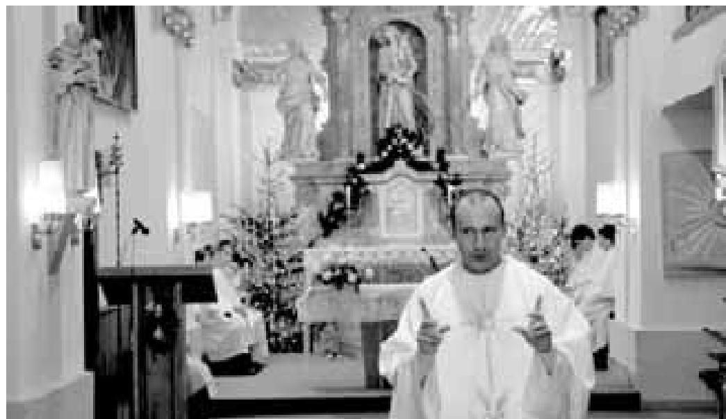
„Myslím, že se u spousty lidí jejich náboženské vzdělání zastavilo v dětském kočárku nebo v prvních letech základní školy.“

Říkám tomu dialogované kázání. Často jsem měl totiž pocit, že když kněz promlouvá k lidem jen od pultíku, odku se čte bible, může nastat určitá bariéra, že lidé přestanou vnímat. A jeden ze způsobů, jak tomuto předejít,